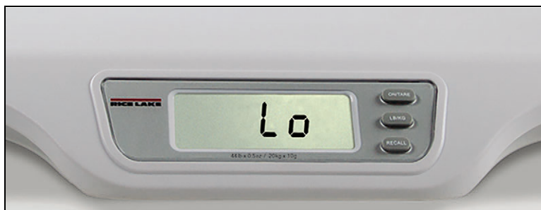
Figura 2-2. Indicador de carga baja de batería

La báscula RL-DBS también puede recibir alimentación de 4 baterías alcalinas AA en caso de no contar con una fuente de alimentación adicional. Una báscula alimentada por baterías se apagará de forma automática tras 2 minutos en desuso para prolongar la duración de la batería. Reemplace las baterías o conecte a una fuente de alimentación de CA lo antes posible si aparece el indicador de carga baja de batería ( Lo ).